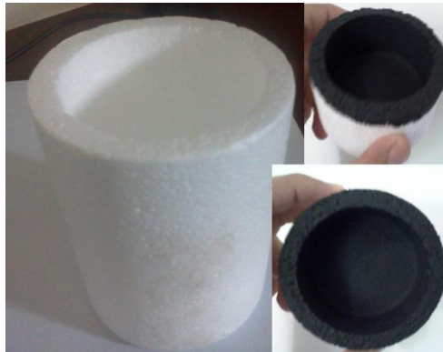
Figura 2: Preparação do recipiente.

Deve-se cortar o recipiente para que o mesmo apresente cerca de 3 cm de profundidade e então pinte a interna (ver figura 2). Preenche-se completamente o recipiente com água à temperatura ambiente, cobre-se a abertura com o filme PVC e, com o conjunto sob o Sol, posiciona-se o termômetro (o termômetro não deve ficar no fundo do recipiente). Simultaneamente a esse procedimento deve-se posicionar um bastão de comprimento conhecido perpendicularmente ao solo e tomar o comprimento da sombra projetada no solo. Naturalmente que a sombra se desloca ao longo da duração da experiência. Assim, pode-se medir o comprimento da sombra no início da experiência e no final da mesma para que se calcule uma média dos valores obtidos.