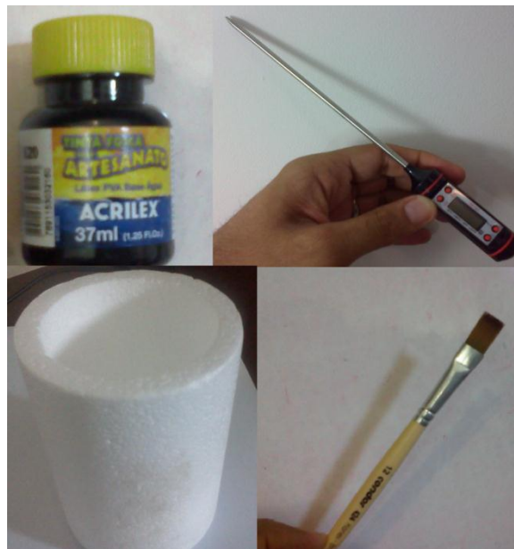
Figura 1: Materiais usados.